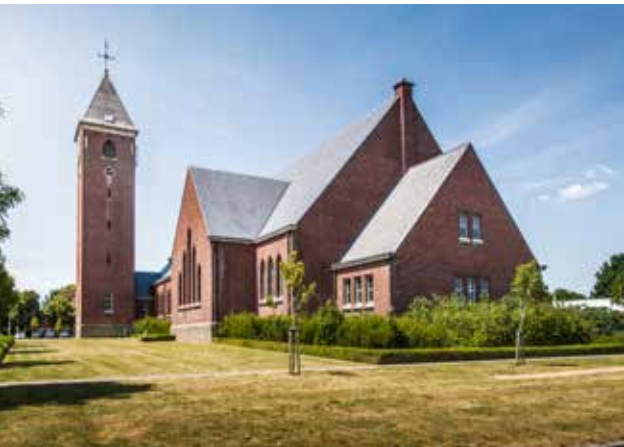
Alken heeft alles: een bereikbare dorpskern, alle diensten, veel groen en een goede ontsluiting.

we veel buurtfeesten. Een cheque van pakweg 125 euro is vaak voldoende, en dan zie je dat de mensen van de wijk buitenkomen, elkaar ontmoeten. Dat versterkt enorm het lokale sociale weefsel, wat toch zo'n beetje het DNA van de N-VA is.'