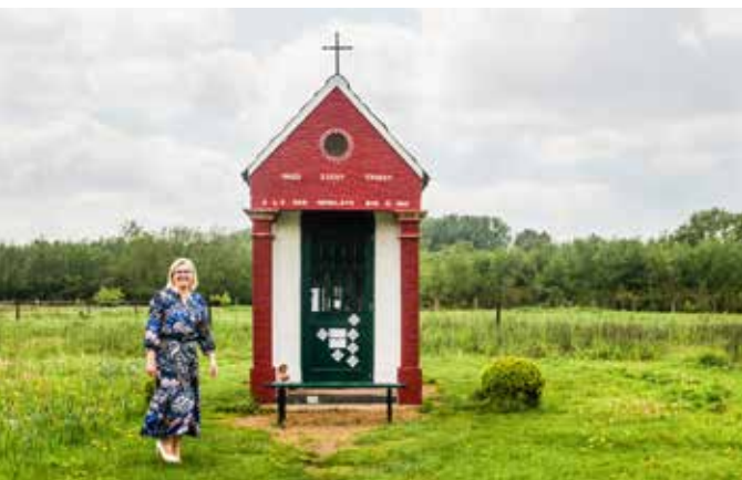
De Pinte is een rijke gemeente, maar kent ook verdoken armoede.

We hebben geen nieuw rusthuis nodig maar moeten investeren in alternatieve zorginitiatieven.