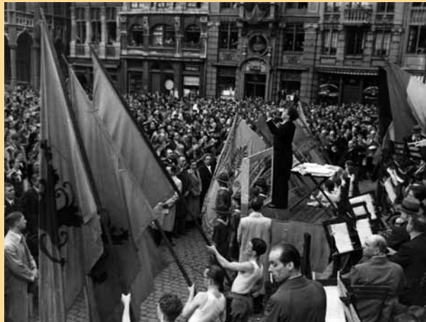
Het vijfde zangfeest (1937) lokte heel wat Vlaamsgezinden naar de Brusselse Grote Markt.

het zingen van de Vlaamse Leeuw en - op aansturen van diezelfde burgemeester - een diplomatiek incident met de regering in Den Haag die een Nederlands dirigent verbood het Wilhelmus te dirigeren, deden de rest. Het vestigde