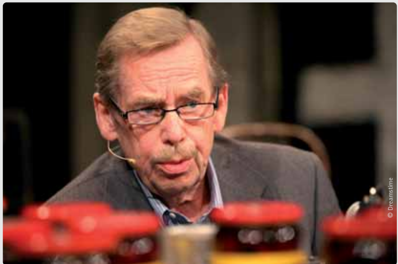
Vaclav Havel, laatste president van Tsjecho-Slovakije en eerste president van Tsjechië.

problemen de grens kan oversteken. Ook op economisch vlak zijn beide landen naar elkaar gegroeid. In 2007 kende Slovakije een economische groei van 10,7 procent. Ook na het uitbreken van de wereldwijde economische crisis bleven de hoogste groeicijfers in de EU van 'de Slovaakse tijger' komen. Sinds 2009 is het land zelfs lid van de eurozone. Politiek is de verstandhouding tus-