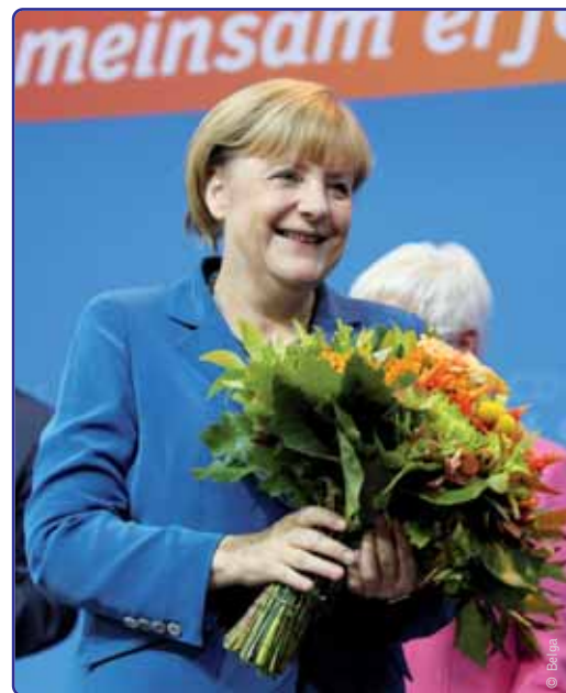
Bondskanselier Angela Merkel wist tijdens de Duitse verkiezingen op 22 september haar positie te versterken.

Eén week vóór de federale verkiezingen waren er ook verkiezingen in de deelstaat Beieren. De CSU haalde hier wel een absolute meerderheid. Denk je dat de uitslag