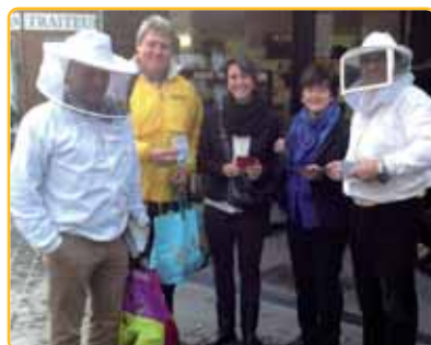
De N-VA-afdeling in pilootgemeente Diepenbeek deelde folders en bloembollen uit.

Ondertussen volgden al meer dan 25 andere afdelingen het voorbeeld van de