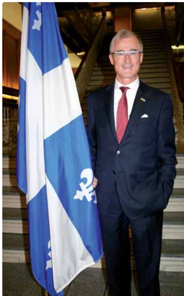
Geert Bourgeois bij de Fleurdelisé, de vlag van Québec: “De Québecse identiteit bestaat niet alleen uit een gemeenschappelijke taal, maar ook uit bepaalde waarden.”

Opvallend is ook dat Québec quota oplegt inzake het aantal immigranten dat de provincie kan onthalen. Die migratiepolitiek leidt ertoe dat meer dan 45 procent van de immigranten in Québec een scholing van meer dan 14 jaar heeft. “Dat is een heel andere populatie dan bij ons, waar het grootste deel van de immigranten laaggeschoold is”, weet Bourgeois. “En dat leidt op zijn beurt tot moeilijkheden bij inburgering en arbeidsparticipatie.”