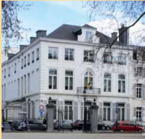
Al 25 jaar hangt de leeuwenvlag onafgebroken aan de gevel van het Hotel Empain.

“De Warande is dé ontmoetingsplaats van Vlamingen te Brussel. Mede door de kwaliteit van haar leden, van haar initiatieven en haar werking, biedt ze de mogelijkheid tot verrijkende ontmoetingen op professioneel, maatschappelijk en cultureel vlak. Bovendien bevordert De Warande de uitstraling van Vlaanderen en zijn contacten met de internationale gemeenschap.” Zo luidt de missie van De Warande vzw.