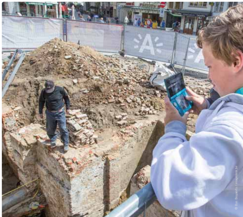
Het nieuwe onroerenderfgoeddecreet komt tegemoet aan de internationale bepalingen op het vlak van archeologisch erfgoed.

De Vlaamse Regering heeft het nieuwe onroerenderfgoeddecreet goedgekeurd. Het wordt binnenkort ter goedkeuring voorgelegd aan het Vlaams Parlement.