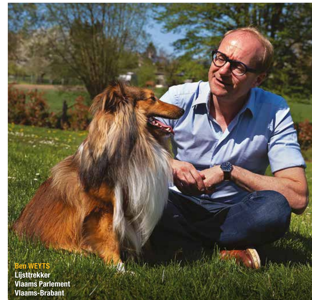
Ben WEYTS Lijsttrekker Vlaams Parlement Vlaams-Brabant

Ben maakte van Vlaanderen de diervriendelijkste regio in Europa. Dat gebeurde niet onopgemerkt. Gaia gaf hem met 16 op 20 een grote onderscheiding voor zijn beleid. En in Hollywood kroop niemand minder dan Pamela Anderson in de pen om Ben te feliciteren.