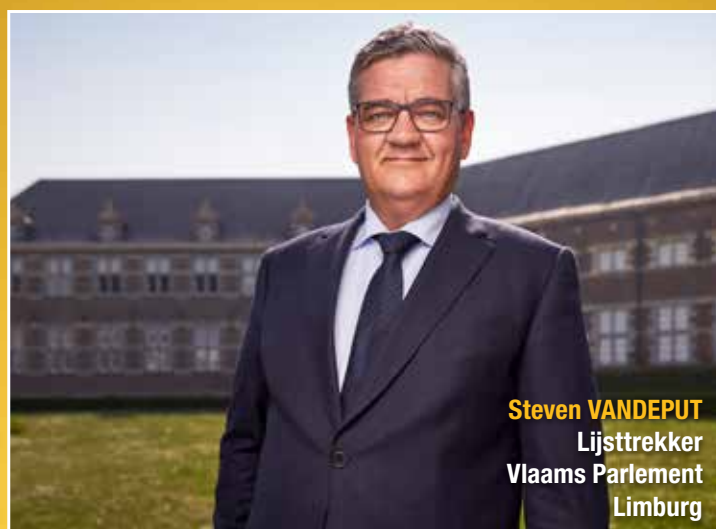
Steven VANDEPUT Lijsttrekker Vlaams Parlement Limburg

“Op de Zuivelmarkt bruist het van het leven. Hier kom je altijd wel iemand tegen die je kent.” Steven Vandeput houdt van heel zijn stad, maar de Zuivelmarkt is zijn lievelingsplekje.