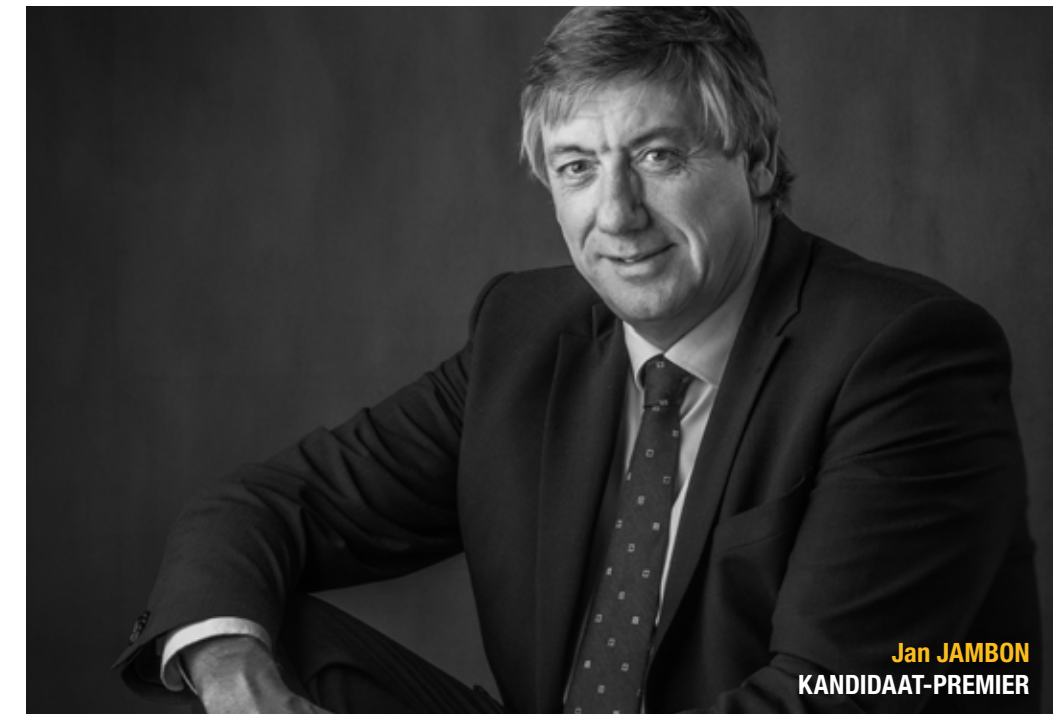
Jan JAMBON KANDIDAAT-PREMIER