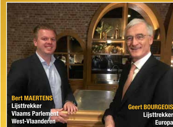
Bert MAERTENS Lijsttrekker Vlaams Parlement West-Vlaanderen