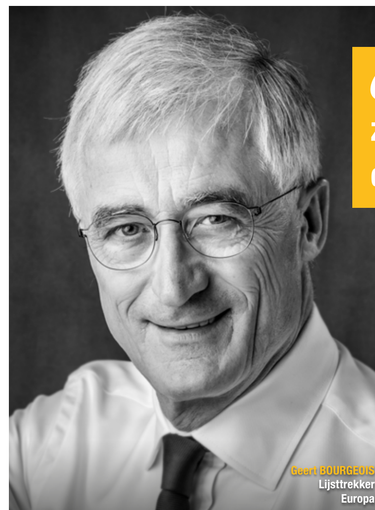
Geert BOURGEOIS Lijsttrekker Europa

“De kracht van Europa zit in zijn verscheidenheid.”