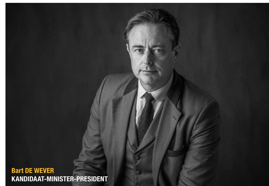
Bart DE WEVER KANDIDAAT-MINISTER-PRESIDENT

Jan Jambon: “Als je van je koepel de instructie krijgt dat je met smileys moet werken in plaats van met punten, of dat je geen kennis of leesvaardigheid meer hoeft te testen, dan blijft dat redelijk onzichtbaar. Maar als er dan een PISA-onderzoek komt dat die kennis en die leesvaardigheid echt test, val je natuurlijk wel door de mand.”