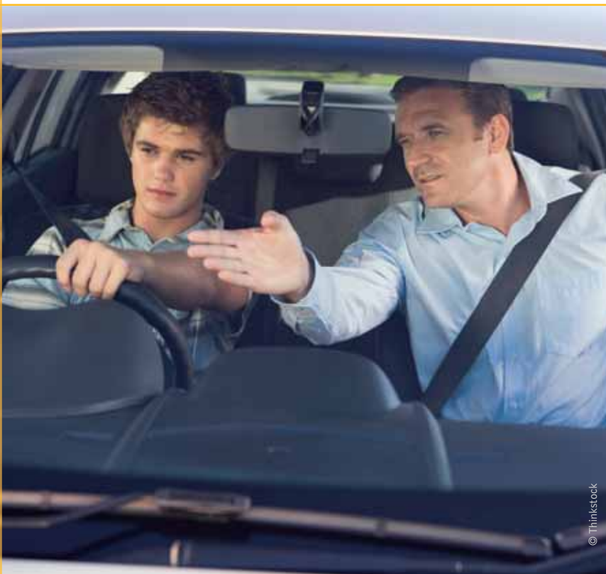
Jong N-VA is voorstander van een meer stapsgewijze rijopleiding, die behalve vaardigheden ook de juiste verkeersattitude aanleert.

Het rijbewijs zoals we het vandaag kennen is geldig voor onbepaalde duur. In samenwerking met de andere gewesten zou moeten worden bekeken of er na een bepaalde termijn een theorietest en een praktische opfrissingscursus kunnen worden ingevoerd. Dat zou in het voordeel zijn van de chauffeur én van de potentiële vrije begeleider.