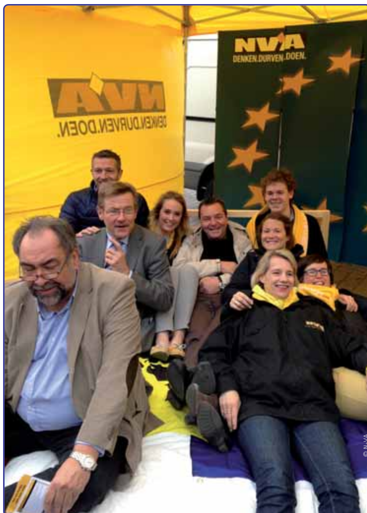
Europa is géén ver-van-mijn-bedshow! Met die boodschap én een bed dat ze zelf in mekaar timmerden, voerden de Europese kandidaten van de N-VA op 9 mei actie op de Meir in Antwerpen.

eens duidelijk. Voor de N-VA is een realistische energiemix cruciaal. Hernieuwbare energie speelt daarin een belangrijke rol. De N-VA steunt daarom het voorstel van de Europese Commissie om voor hernieuwbare energie op Europees niveau een bindende doelstelling naar voor te schuiven. Tegelijk verwelkomen we de flexibiliteit die de lidstaten hebben om zelf hun energiemix te bepalen. Want niet elke lidstaat heeft evenveel potentieel voor hernieuwbare energie. Voor de N-VA blijft de sleutel ook bij meer energie-efficiëntie liggen. De N-VA is er al lang voorstander van dat ook op dat vlak op Europees en lidstaatniveau bindende doelstellingen worden vastgelegd. Want de goedkoopste energie is de energie die niet wordt gebruikt.