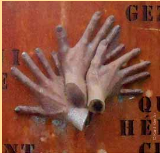
Detail uit het herdenkingsmonument van beeldhouwer Etienne Desmet aan het station van Boortmeerbeek: voor vrede en verdraagzaamheid.

Sinds december 2012 is 'Kazerne Dossin' in Mechelen een memoriaal, museum en documentatiecentrum over de Holocaust. Tijdens de Tweede Wereldoorlog fungeerde de kazerne als verzamelen doorgangskamp: tussen juli 1942 en juli 1944 brachten achttwintig treinkonvoien van hieruit 25 257 Joden en 351 Roma naar (meestal) Auschwitz. Minder dan vijf procent van hen keerde levend terug.