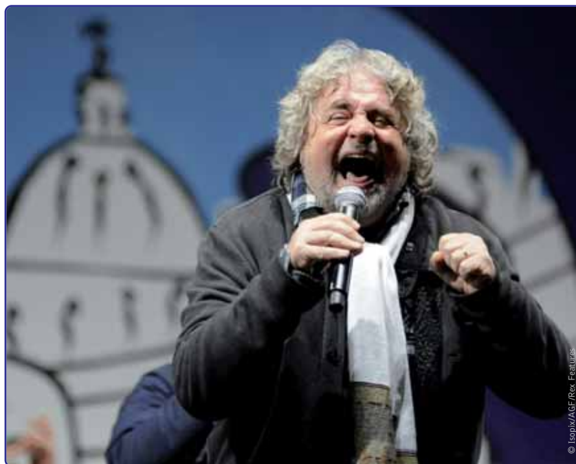
Beppe Grillo's aantrekkingskracht is te verklaren door zijn afkeer tegen de heersende politieke klasse, tegen Monti en tegen Brussel.

De ogen van Europa zullen de volgende dagen, weken en maanden op Italië gericht blijven. De Duitse minister van Buitenlandse Zaken Guido Westerwelle heeft Rome al een duidelijke boodschap gestuurd: Italië dient zich aan de besparingsplannen te houden. Welke regering er aan zet komt en of er eventueel nieuwe verkiezingen moeten worden uitgeschreven, valt nog af te wachten. Maar de hoop dat de eurocrisis in de Mediterrane lidstaten tot een einde komt, lijkt door deze nieuwe Italiaanse crisis een pak minder waarschijnlijk.