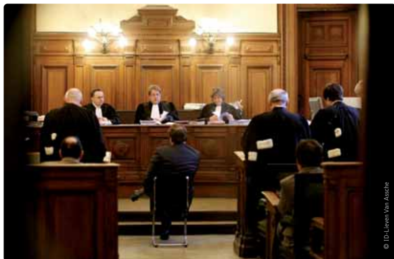
Topjobs zoals procureur des konings en arbeidsauditeur worden in het tweetalige Brussel gereserveerd voor Franstalige gediplomeerden.

De folder BHV splitst à la Belge (september 2012) met meer informatie over deze discriminaties is nog steeds beschikbaar als PDF op www.n-va.be/BHV-folder