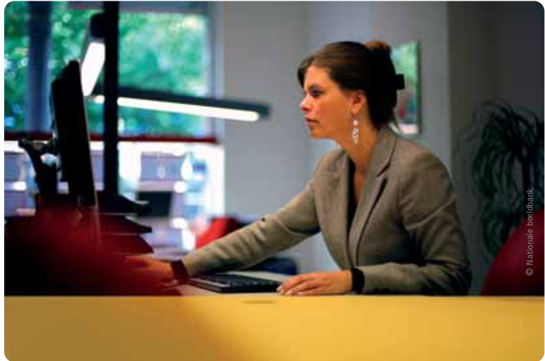
Geert Bourgeois: “De afslanking van het personeelsbestand zorgt voor een grote besparing.”

Op initiatief van minister Bourgeois besliste de Vlaamse Regering dat er