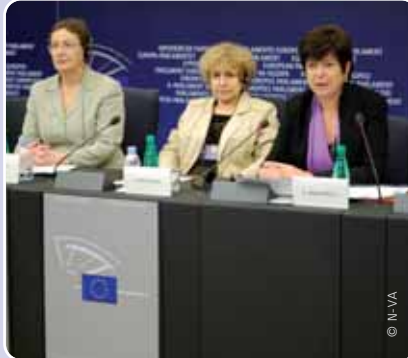
Tijdens een persconferentie in het Europees Parlement riep Frieda Brepoels samen met enkele collega-parlementsliden de EU op tot actief engagement.

Ook Europees Parlementslid Frieda Brepoels (N-VA) verwacht veel van de internationale gemeenschap, en in het bijzonder van de Europese Unie: "Tot nog toe wimpelden de Europese Commissie en de Raad het conflict af als een interne Spaanse aangelegenheid. Dat kan nu niet meer.