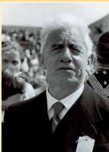
Vlaams filmpionier Clemens De Landtsheer in 1960

Een tentoonstelling in zijn geboortestad Temse, een boek en een DVD deden de rest.