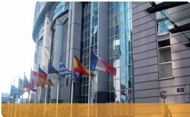
Het zijn Vlaamse en Waalse ministers die het Belgische voorzitterschap rethouden.

Het blijft echter een handicap dat onze regionale ministers in de Europese ministerraden een Belgisch standpunt moeten overbrengen, zeker als het gaat om exclusieve bevoegdheden van de deelstaten. Ook voor Europese materies is het immers