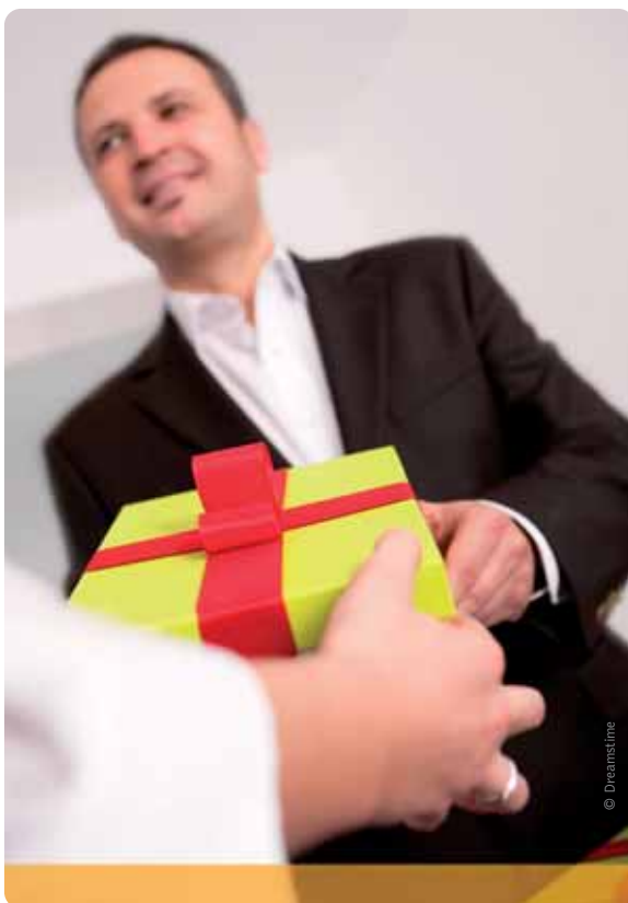
Mogen ambtenaren nog relatiegeschenken aannemen?

De overheid heeft een voorbeeldfunctie. Ze moet eigenlijk een 'glazen huis' zijn dat volledig transparant is. Elke schending van de integriteit is er één te veel. Het straalt niet alleen negatief af op de Vlaamse overheid in haar geheel maar ook op de vele medewerkers die wél integer zijn. Daarom moeten we werk maken van preventie zowel als detectie.