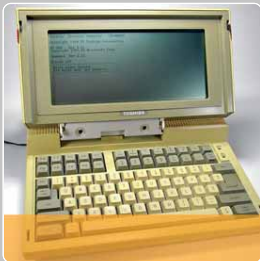
De zogenoemde "Toshiba-boys" van Jean-Luc Dehaene waren de kabinetards die in 1989 met hun Toshiba-computers de modellen voor de financieringswet uitdokterden.

Het N-VA-dossier "De Belgische financieringswet: de mythe doorpikt" uit februari 2008 is nog steeds actueel. U vindt het op www.n-va.be/dossiers/belgische-financieringswet-de-mythe-doorpikt