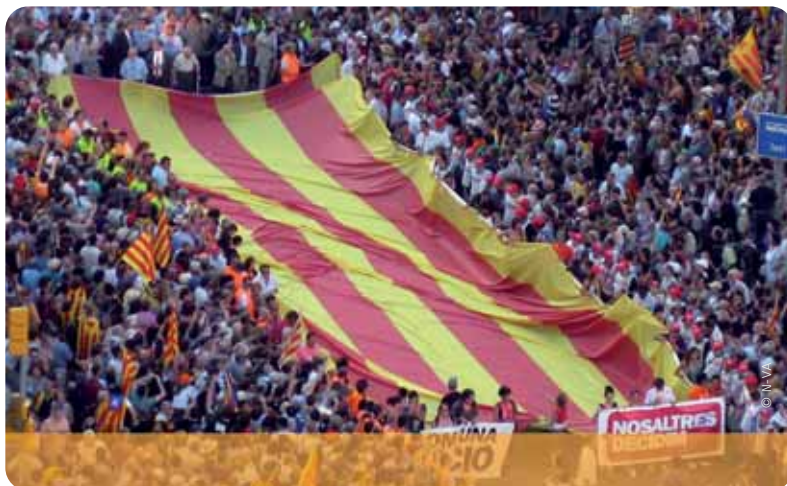
Een miljoen Catalanen schaarde zich achter de Senyera.

Op kop stapte de Catalaanse president, José Montilla, geflankeerd door zijn voorgangers en de leiders van alle Catalaanse politieke partijen. In hun zog volgden tal van prominenten uit culturele en sociale middens, vertegenwoordigers van vakbonden en werkgeversorganisaties. We zagen kortom een algemene mobilisatie van het Catalaanse volk, verenigd onder de aloude leuze "som una nacio": wij zijn een natie!