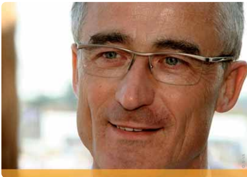
Vlaams minister Geert Bourgeois stelt in zijn groenboek 80 concrete maatregelen voor.

Een efficiëntere overheid betekent ook duidelijke taakafspraken tussen