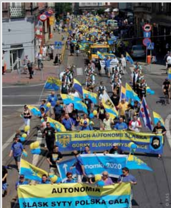
Vierduizend Sileziërs kwamen in Katowice op straat voor meer zelfbestuur.

De betoging eindigde symbolisch aan het gebouw waar in de jaren twintig het parlement van het Autonome Vojvodschap Silezië was gevestigd. De RAS hoopt met het