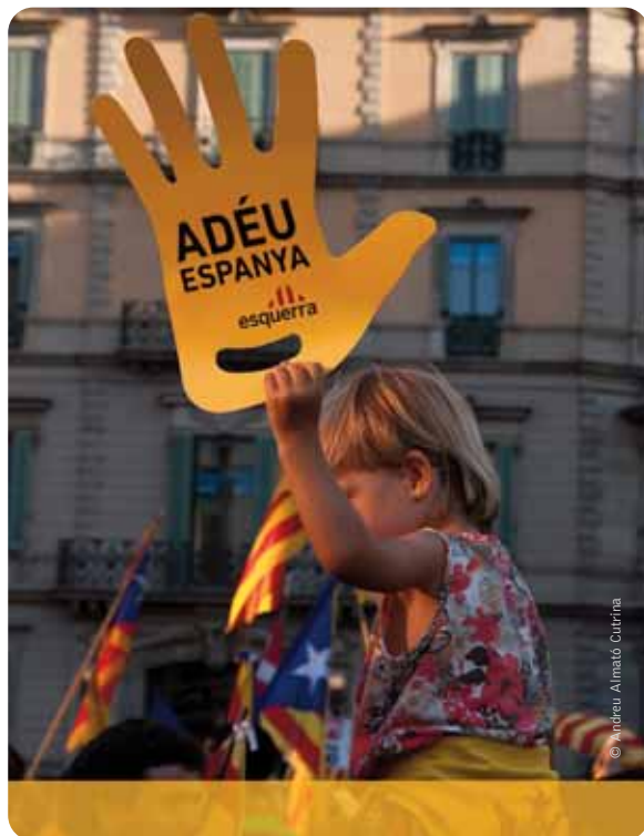
Een steeds groter deel van de Catalaanse bevolking is gewonnen voor Catalaans zelfbestuur.

noodzaak om het bestaande autonomiestatuut van 1978 te actualiseren. Het "Estatut" regelt onder meer de overdracht van het gerecht en van belangrijke fiscale en andere bevoegdheden. Het geeft de contouren aan van de Catalaanse autonomie.