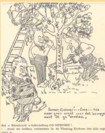
Uit 'De Volksunie' van 4 juli 1959

besturen om aan die telling mee te doen, bleven niet zonder gevolg. De geplande telling van 1957 werd uitgesteld tot 1 januari 1960, maar het verzet van Vlaamse kant nam in het najaar van 1959 niet af. In november organiseerde het VABT een 'geen-talentelling-zondag'. Het nog jonge Aktiekomitee organiseerde 71 plaatselijke manifestaties, wat resulteerde in een massa protesten die naar premier Gaston Eyskens (CVP) werden gestuurd. Ook twee bekende Vlaamse schrijvers, de katholiek Stijn