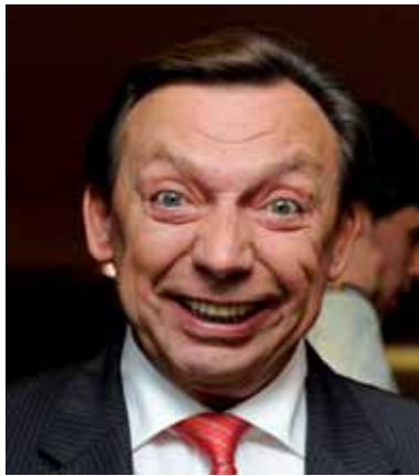
PS-minister van Pensioenen Michel Daerden: misplaatste olijkheid.

Er bestaat wel een Zilverfonds, het paradepaardje van de vroegere sp.a-minister van Begroting Johan Vande Lanotte. Dat Zilverfonds, opgezet in 2001, is op sterven na dood. Het fonds zou gestijfd worden met begrotingsoverschotten, maar de jongste jaren is er nauwelijks