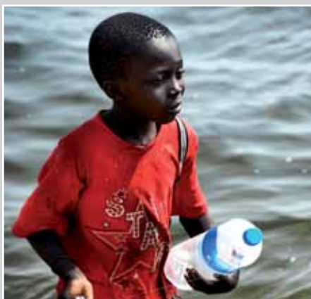
De onafhankelijkheidsstrijd gaat ook over het bezit van water, landbouwgrond en olie.

Soedan was in de 19de en 20ste eeuw een Brits-Egyptische kolonie met een sterke etnische en religieuze diversiteit. Terwijl het noorden voornamelijk islamitisch is, overheersen in het zuiden christelijke en ani-