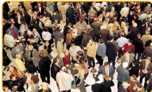
"Nieuwe partij van Geert Bourgeois lokt bijna 1.500 Vlaams-nationalisten naar Gents congrescentrum." (De Morgen, 3 december)