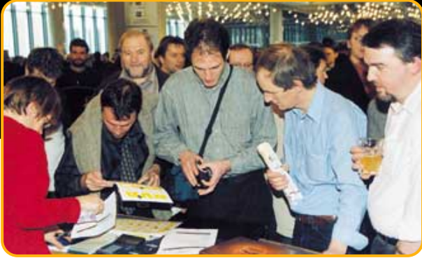
Na de meeting werd het geïmproviseerd N-VA-secretariaat overrompeld voor de aankoop van nagelnieuw promotiemateriaal.