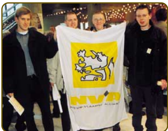
Deze jongeren lopen alvast warm voor de N-VA.