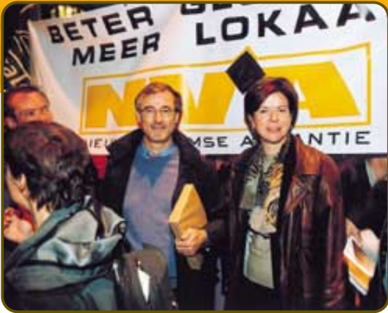
De N-VA op de betoging in Gent. Geen enkele partij, die naam waardig, kan voorbij aan het fenomeen van de globalisering.