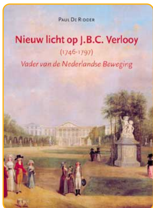
Zicht op het stadspark van Brussel met het gebouw van de Raad van Brabant, nu het federaal parlement. Schilderij uit 1785, jaar waarin Verlooy zijn brief naar Wenen schreef.

In 1788 publiceerde de Brusselse advocaat Jan-Baptist Verlooy zijn Verhandeling op d'Onacht der Moederlyke Tael in de Nederlanden . De uitgave wordt beschouwd als hét begin van de Vlaamse beweging en de