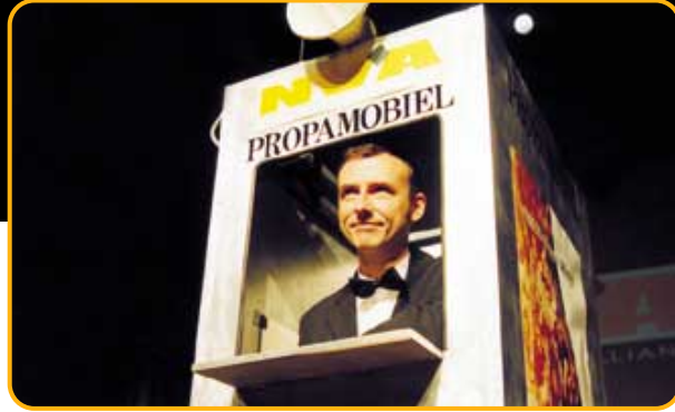
Voor de vrolijke noot zorgde Aksident, een stel leuke grappenmakers.