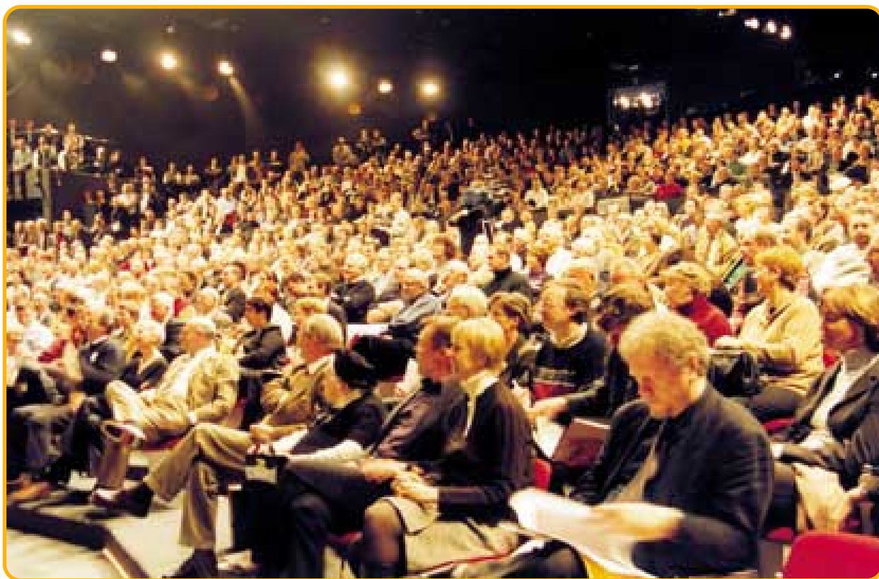
"Eerste partijcongres N-VA lokte verrassend veel volk." (Het Nieuwsblad, 3 december)

Vervolgens nodigde de presentatrice drie vrouwen en drie mannen uit op de praatstoel.