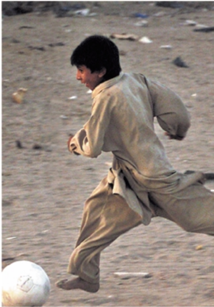
Vluchtelingen speelbal van politiek.