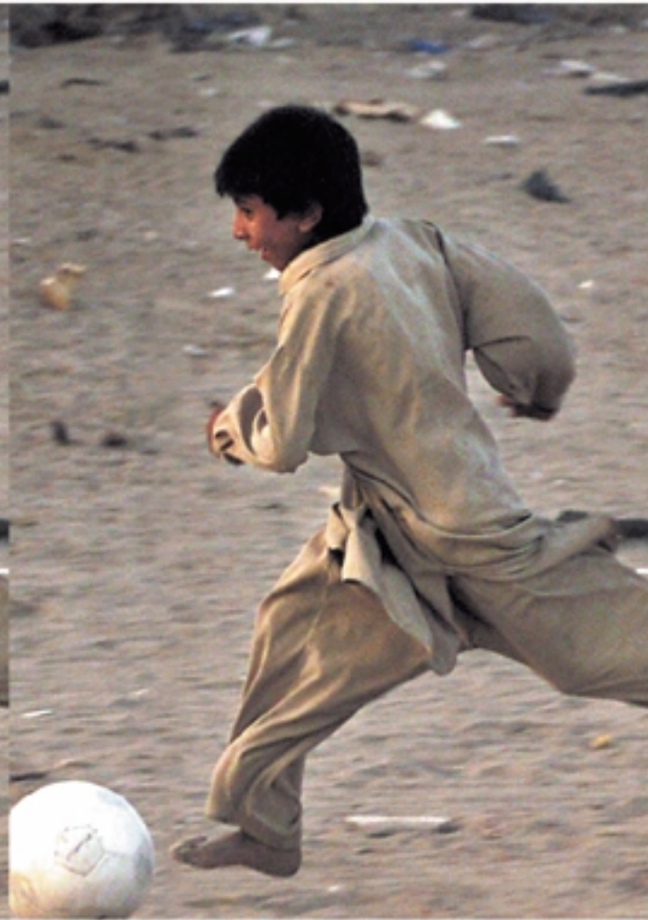
Met de rugzak door Pakistan.

ELKE WEEK VERSCHIJNT HET KNACK-PAKKET MET 3 VERSCHILLENDE MAGAZINES