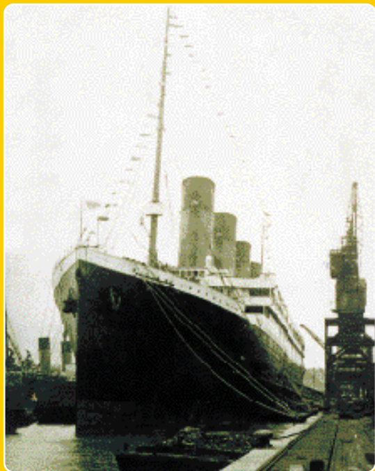
In feite is elke Titanic-reiziger een tentoonstelling waard.

In de nacht van 10 april 1912 verdronken twintig landgenoten, enkele uren nadat de Titanic een ijsberg schraapte. Zeven anderen slaagden erin een plek te bemachtigen in de reddingsboten. Hun levensverhaal is te zien in de tentoonstelling 'De Vlamingen op de Titanic' in de Kunsthall Sint-Pietersabdij in Gent.