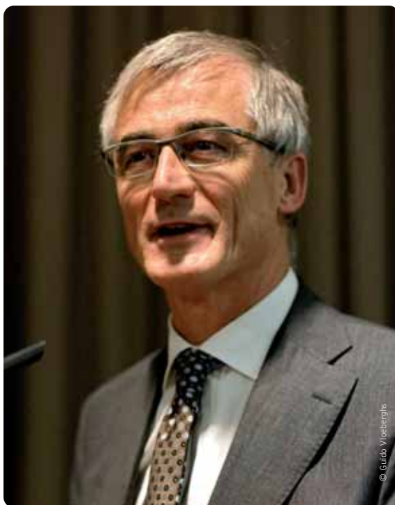
Vlaams minister Geert Bourgeois: “Na de gemeenteraadsverkiezingen van 2012 zullen de gemeentebesturen heel wat minder planlasten hebben.”

Geert Bourgeois: “Vandaag moeten gemeentebesturen elk jaar allerlei beleidsplannen opmaken: een sociaal beleidsplan, een ouderenbeleidsplan, een sportbeleidsplan, een jeugdwerkbeleidsplan, een cultuurbeleidsplan, en noem maar op. Ze moeten daarin uitschrijven wat ze met hun beleid van plan zijn. Op basis van die documenten wordt nadien het beleid geëvalueerd. Ondertussen bestaan er meer dan dertig verschillende planningsdocumenten. Elke beleidssector heeft immers zijn eigen plannings- en rapporteringsverplichtingen. Een integraal en samenhangend beleid is daardoor gewoon onmogelijk.”