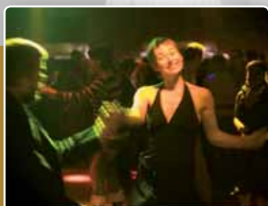
22 januari 2011: N-VA-Nieuwjaarsfeest