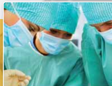
Strategieën voor orgaandonatie