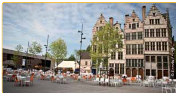
Domein Bokrijk maakt zich op om 10 jaar N-VA te vieren.

We willen Vlaanderen duidelijk maken dat we niet enkel politiek de grootste partij zijn. Onze leden zijn ook het meest enthousiast, veelzijdig en bevlogen. Hiervoor rekenen we op jullie massale aanwezigheid.