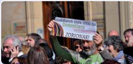
“Het moment voor verandering is aangebroken in Donostia. Proficiat!”

In de Spaanse media haalden de resultaten van de nationalisten uit de ‘opstandige’ regio's alle voorpagina's. Vooral de uitslag van het kort voor de verkiezingen ten dode opgeschreven Bildu sprong in het oog. De intentie om de nieuwe partij te kraken had duidelijk een averechts effect. Als een boemerang kwam Bildu terug in het gezicht van diegenen die haar op een onrechtmatige en onrechtvaardige manier trachtten te muilkorven. Vanuit het niets brak de partij door in heel Baskenland en Navarra. Neem nu de tot de ver-