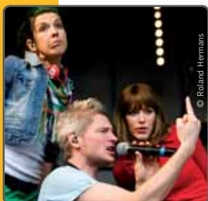
De Ketnetband brengt een onvergetelijke, swingende en 'ketnetgekke' show!

Tussen alle brood en spelen door zetten we ook onze jarige partij in de bloemetjes! Voorzitter Bart De Wever kijkt terug op memorabele momenten en blikt vooruit naar de volgende tien jaar. We ontdekken ook wie De Slimste N-VA'er is wanneer parlementsleden de quizvragen van N-VA-leden beantwoorden. Aan de verkoopsstand kan je N-VA-promotiemateriaal inslaan. Daarnaast gaat de dvd '10 jaar N-VA' in première.