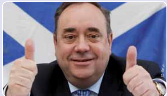
Regeringsleider Alex Salmond trok de kaart voor meer Schotse autonomie. Dat recept werd in Schotland meer dan gesmaakt.

Onze trouwe bondgenoot in de Europese Vrije Alliantie ging met open vizier naar de kiezer. De SNP leidde Schotland tijdens de vorige legislatuur met een minderheidsregering. Regeringsleider Alex Salmond trok, ondanks forse oppositie, de kaart voor meer Schotse autonomie. Dat de kiezer massaal steun verleende