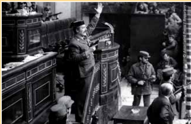
Dertig jaar geleden viel Antonio Tejero met pistool in de hand het Spaanse parlement binnen.

De koning steunde uiteindelijk de opstand niet. Juan Carlos kreeg daardoor het aureool van redder van de