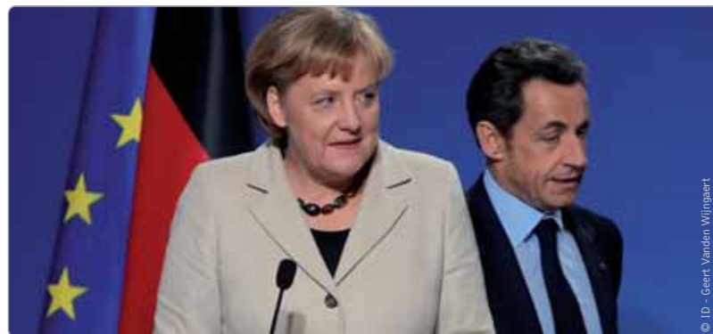
Angela Merkel en Nicolas Sarkozy: “Het multiculturalisme is mislukt.”

“In al onze democratieën is men te veel bezig geweest met de identiteit van wie aankwam en te weinig met de identiteit van het ontvangende land”, bevestigde de Franse president Sarkozy. En in het Nederlandse tv-programma “College Tour” verklaarde Maxime Verhagen onlangs nog dat het idee om alloctonen en autoctonen naast elkaar te laten leven, compleet mislukt is.