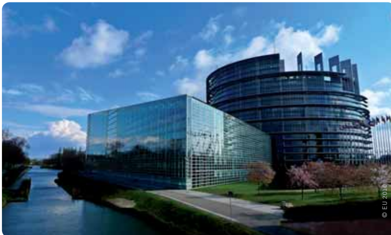
De gebouwen in Straatsburg staan veertig weken per jaar leeg. Dat kan efficiënter, vindt Frieda Brepoels.

Compensatiemogelijkheden voor 'Stressburg' zijn er zeker. Zo pleit Europees Parlements lid Frieda Brepoels er al lang voor om het Comité van de Regio's en het Europees Sociaal en Economisch Comité naar Straatsburg te verhuizen. Dat zou een win-winsituatie zijn voor iedereen: een optimalisering van de huidige infrastructuur (de gebouwen in Straatsburg die nu veertig weken per jaar leeg staan, zouden constant gebruikt worden),