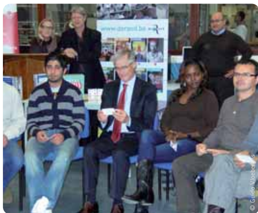
Minister Bourgeois mocht even meespelen met het educatieve spel 'De Marktkramers'.

Dat lijkt misschien gemakkelijk, maar in de praktijk schakelen veel Nederlandstaligen - uit behulpzaamheid - over op het Frans, het Duits of het Engels. Dat is jammer, want het ontnemt de anderstaligen een kans om te oefenen.