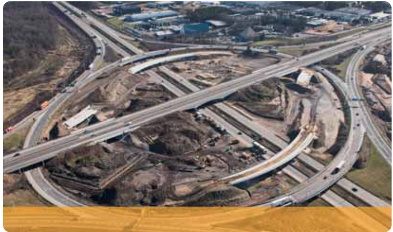
Grote investeringsprojecten zoals de heraanleg van het klaverblad in Lummen kunnen in de toekomst sneller uitgevoerd worden.

De projecteigenaar dient eerst zijn project in bij de betrokken overheid. Die neemt al dan niet een startbeslissing. Een procesnota omschrijft alle actoren en alle stappen die het pro-